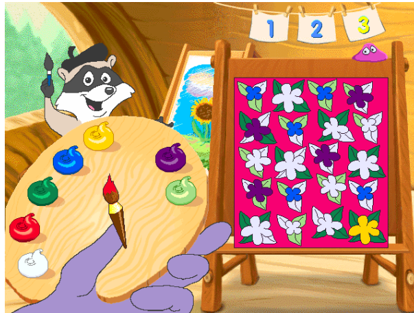
1.2. att. Otrā attēla nosaukums

eros lacus, viverra eget, rhoncus pretium, convallis a, pede. Pellentesque hendrerit. Quisque pharetra leo sed augue. Morbi elementum neque sed massa. Pellentesque habitant morbi tristique senectus et netus et malesuada fames ac turpis egestas. Duis libero elit, hendrerit ac, cursus id, condimentum laoreet, leo. Suspendisse ullamcorper enim ac massa. Aliquam leo nibh, varius at, congue at, porta id, nunc. Suspendisse ornare. Vestibulum vulputate dignissim mauris. Nulla orci libero, lobortis laoreet, suscipit in, semper nec, tellus. In hac habitasse platea dictumst. Quisque augue.